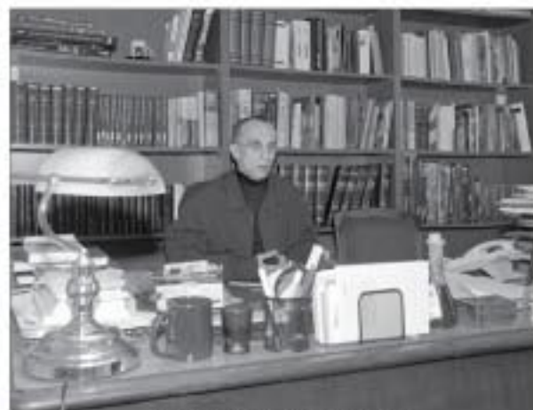
У библиотеци - на радном месту

У: Овдје (Титоград). – Год. XXIII, бр. 278 (фебруар, 1992), стр. 37.