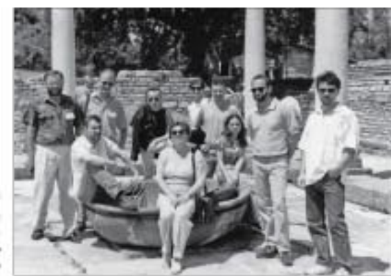
Гамбург, мај 1997. – у друштву песника и књижевних критичара на Фестивалу поезије „Младомаци“

Након сваке смрти Млечни и/уи/и нарастае за једну каи. Изорана је земља око Тврђаве, и/одити/и/и мост и/, у даљини, умована и/ривика, као и/ла, уи/ива хоризонт.