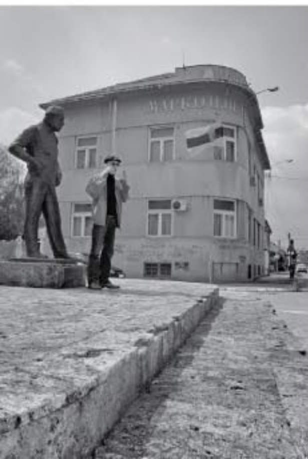
Испред библиотеке и споменика Зорану Радмиловићу у Зајечару