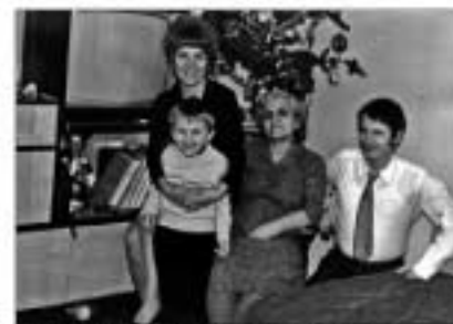
Породица Јеленковић са бака Персом