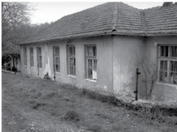
Школа у Пришти, 2010.

(Београд, Српска књижевна задруга, 1987, стр. 132)