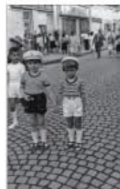
Са другаром, карневал поводом Дана младости (25. мај) - Неготин, 1969.