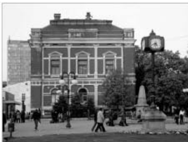
Општински суд у Зајечару

Додатак: Култура, уметност, наука. – Год. XLIII, бр. 34 (4. децембар 1999), стр. 26.