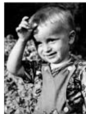
Портрет (око три године)