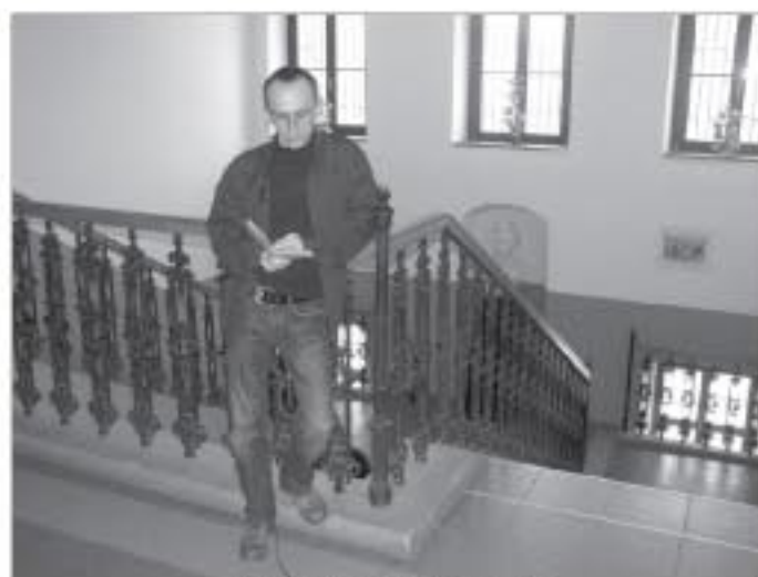
Песник у својој и Дисовој школи