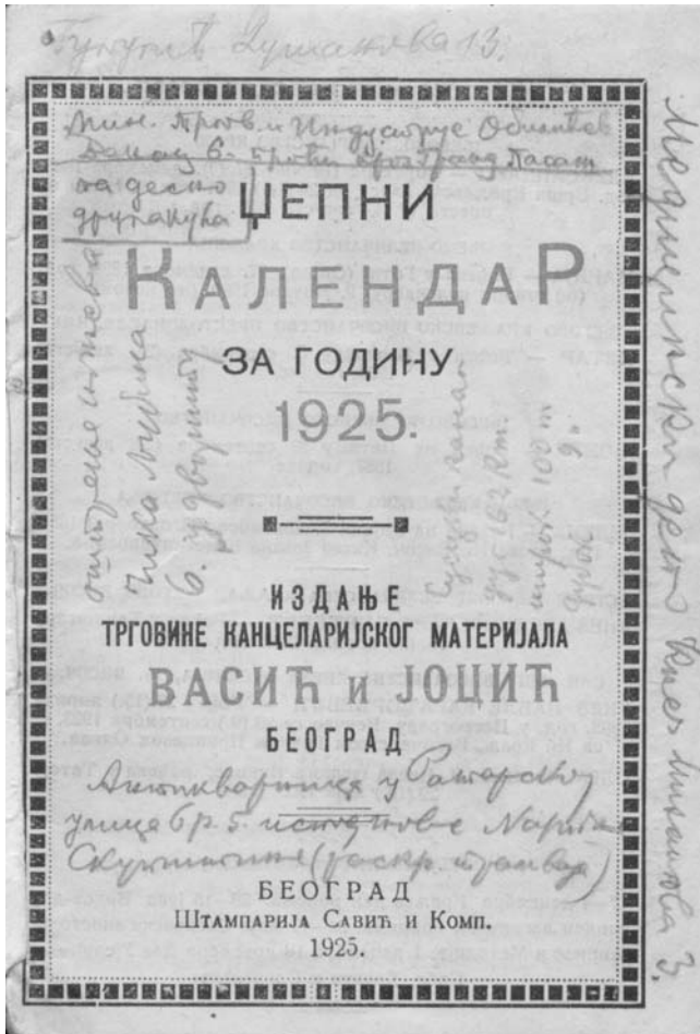
Белешке Миливоја Филиповића – прилоз за књижарску топографију Београда у првој половини 20. века