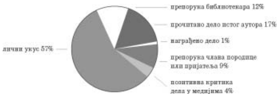
Дијаграм 3: Пресудни чиниоци при избору литературе на основу резултата анкетног упитника