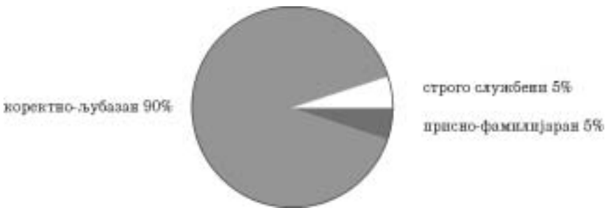
Дијаграм 4: Однос анкетираних читалаца према библиотекарима (анкетно питање бр. 10)

Као што резултати анкете показују, жене су редовнији и чешћи чланови позајмног Одељења за одрасле читаоце Градске библиотеке у Чачку. Од 100 испитаника 81 жена је попунила анкету, стога су даме ревносније у потражи за добром литературом, па и вернији читаоци такозваних женских романа, љубавних прича и породичних драма. Од 100 испитаника 71 чита сентименталне романе, трилере чита 51, дела друштвено-политичке садржине чита 38, биографије уметника и научника – 75 анкетираних. Занимљиво је и то да се 88 читалаца определило за роман као књижевну врсту коју најчешће чита. У Позајмном одељењу, у току дванаесточасовног дневног рада библиотекари услуже преко 350 корисника.