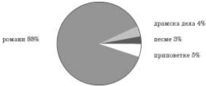
Дијаграм 1: Најчешћаније књижевне врсте на основу одговора на анкетно ишћање бр. 1