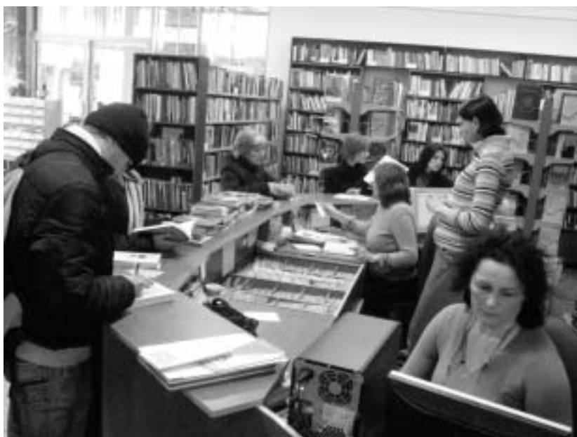
Позајмно одељење за ограсле читаоце