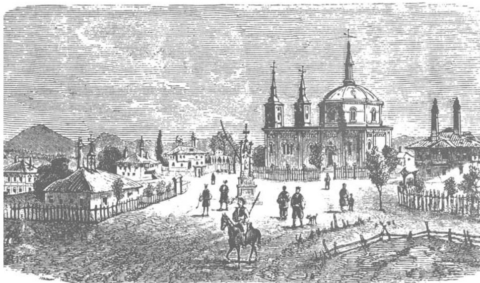
Чачак, главни Шпѣ са црквом (ѣрафика Феликса Каница из 1860. ѣодине)