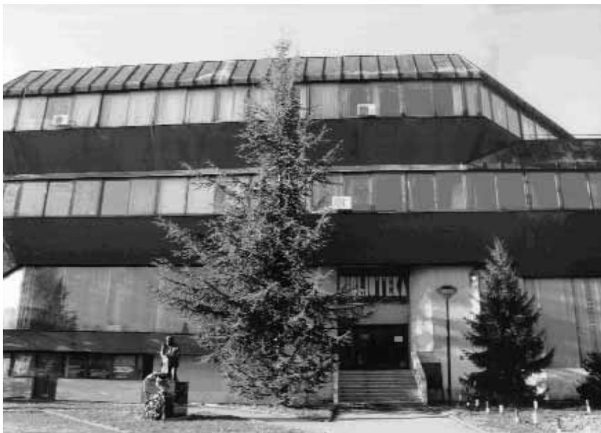
Дом радничке солидарности гдје је смјештена Народна и универзитетска библиотека Републике Српске