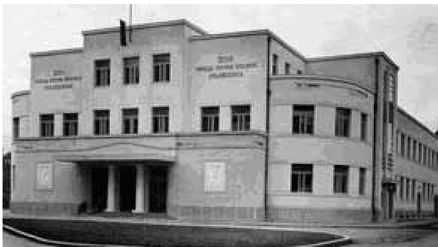
Спомен-дом краља Петра I Ослободиоца у коме је била смјештена Библиотека